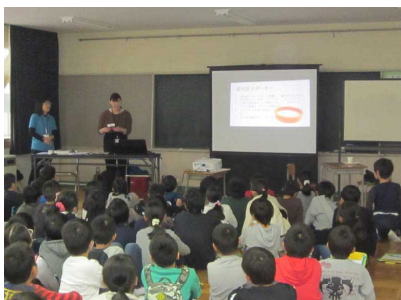
講師：長寿支援課職員

認知症に対する正しい理解や認知症の人に対してできることはなにか、ロールプレーを通して学習しました。