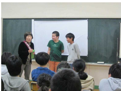
講師：更生保護女性会

ビデオの視聴やたばこの害についての実験、ロールプレーを通してたばこの怖さについて学習しました。写真はたばこの誘惑を、断っている場面です。