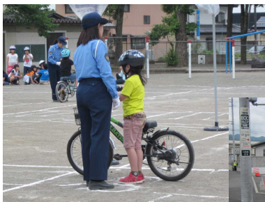
←安全な自転車の乗り方

※自転車の加害事故による、多額の治療費の支払いが求められているなどの話もありました