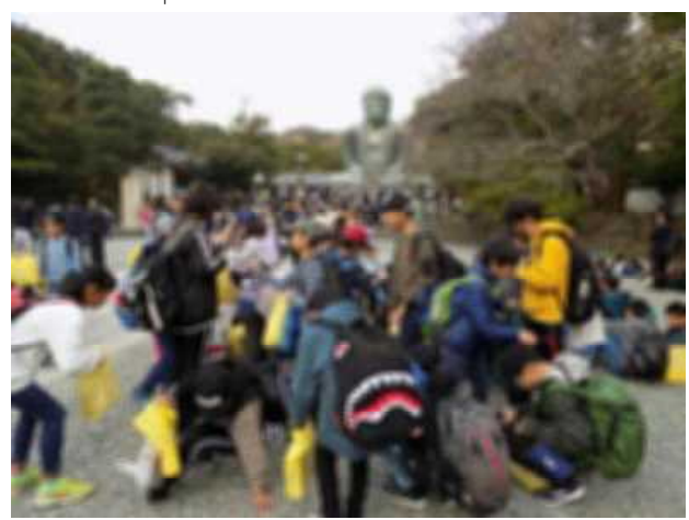
<鎌倉の大仏のある高徳院境内にて>↑