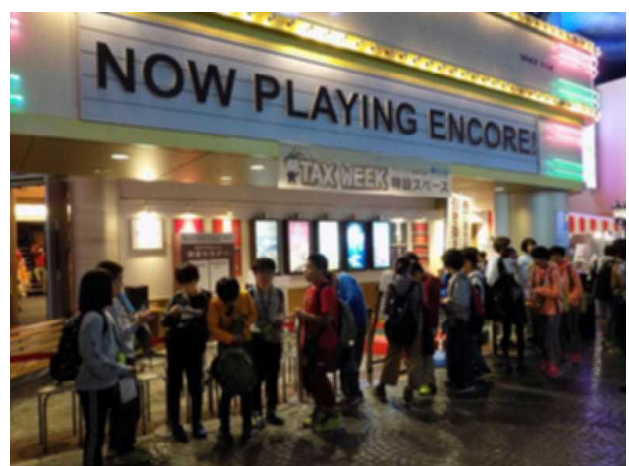
<2日目に訪れたキッザニア東京>↑

班行動では興味・関心をもち、見たり聞いたりと精力的に動き回る姿が印象的でした。事前学習で認識してあることを生かし仏像や観音像、歴史的に有名な建造物などを鑑賞して回りました。鎌倉の小町通りでは、お土産探しや店頭でつまみ食いなど実に楽しそうでした。新横浜プリンスホテルでは豪華な夕食に大満足。2日間、6年生1人1人にとって思い出深い修学旅行となったようでした。