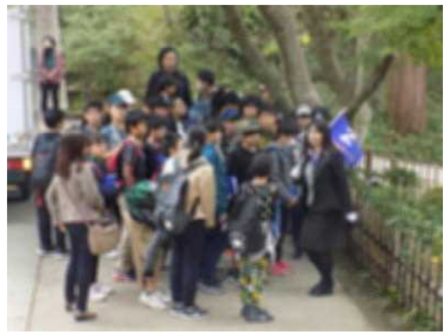
↑<円覚寺の境内にて>↑