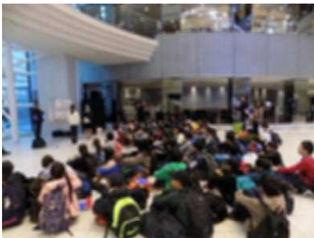
<宿泊地の新横浜プリンスホテル>↑