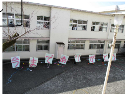
ありがとうのメッセージ (中庭から6年生の教室に向けて)

3月2日(水)朝から1時間目にかけて、卒業を祝う会が行われました。事前に収録した映像を視聴しての実施となりました。各学年の皆さん、気持ちのこもった発表をありがとうございました。