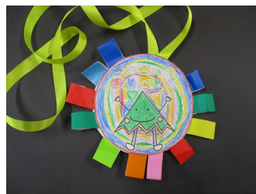
2年生より、6年生一人一人に「ペンダント」が贈られました。