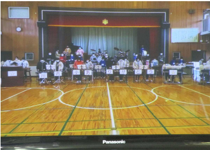
5年生 実行委員のみなさん 卒業を祝う会の企画、運営ありがとうございました。