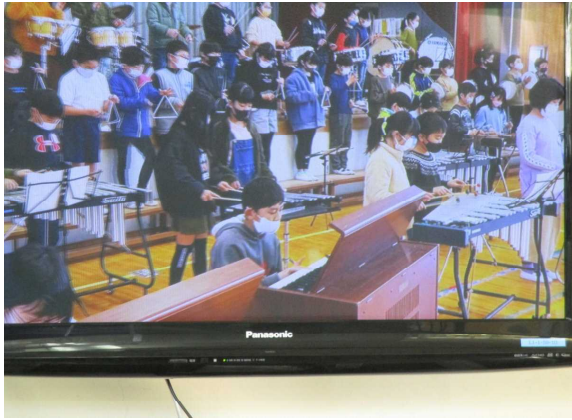
4年生合奏「スーパ-カワラガリスティックレピ°アリド-ヤス」 「6年生を素敵な音楽の世界に招待します。速さを変化させながら演奏します。皆で気持ちを一つに合わせて、がんばります。」