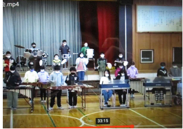
5年生 合奏「キリマンジャロ」 「6年生になったら、委員会で皆をリードできるようにがんばります。クラブでは下級生と仲よくがんばります。」