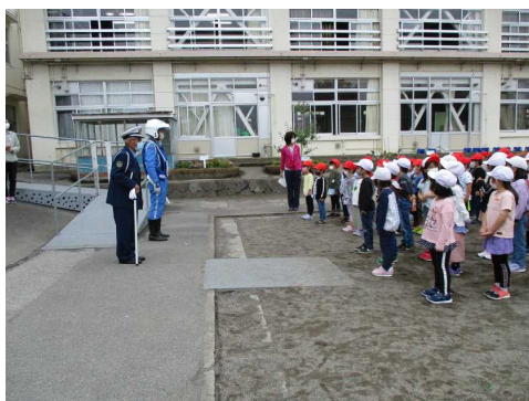
<警察の方や交通指導員さんに あいさつをする1、2年生>