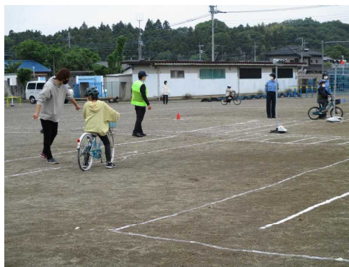
<自転車の正しい乗り方について 指導を受ける3年生>

道路の要所要所には、警察の方や交通指導員さんに立っていただき、横断歩道を渡る際には左右を確認してから渡ること、道路の右側を歩くことなどを丁寧にご指導いただきました。この学習を生活場面に生かせるようにしましょう。